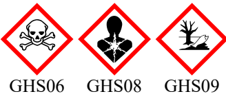
GHS06 GHS08 GHS09