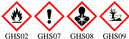
GHS02 GHS07 GHS08 GHS09