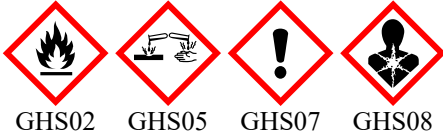
GHS02 GHS05 GHS07 GHS08