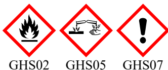
GHS02 GHS05 GHS07